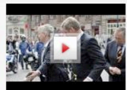
EKLAT IN WIESBADEN Wulff mit Eiern beworfen