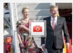
LATEINAMERIKA-REISE Bettina Wulff - kleiner Schwäche-Anfall