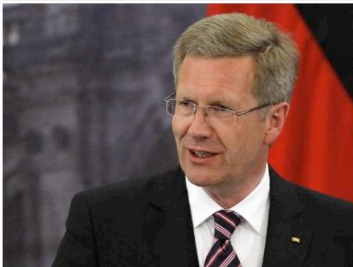
Bundespräsident Christian Wulff