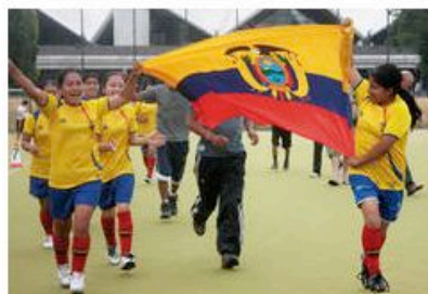
Spielfreude entdecken - discover football

Mit Unterstützung der DFB-Kulturstiftung, des Auswärtigen Amtes und des Bundesinnenministeriums fand die Premiere des Frauen-Fußball-Kultur-Festivals im Juli 2010 auf dem Lilli-Henoch-Sportplatz am Anhalter Bahnhof statt. Zu Gast: Mannschaften aus Afghanistan, Serbien, Sambia, Ecuador, Paraguay, Österreich und Israel/Palästina. Ein vielfältiges Kulturprogramm sorgte für spannende Begegnungen auf und neben dem Fußballplatz. Dass während des Festivals Frauen zusammenkamen, die neben ihrer